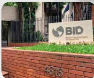
BANCO INTERAMERICANO DE DESARROLLO