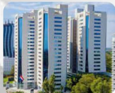
WORLD TRADE CENTER