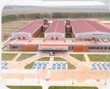
HOSPITAL REGIONAL OVIEDO