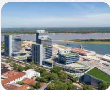
OFICINA DE GOBIERNO