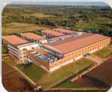
GRAN HOSPITAL DEL SUR