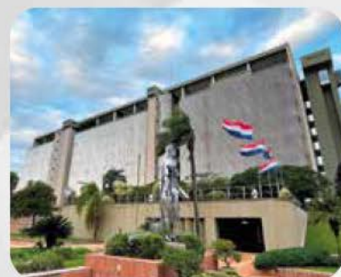
BANCO CENTRAL DEL PY