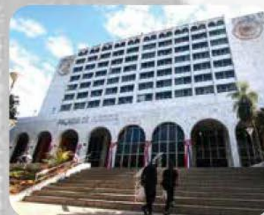
PALACIO DE JUSTICIA