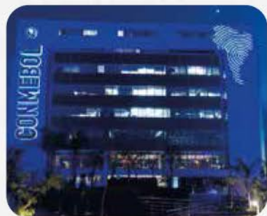
CENTRO DE CONVENCIONES CONMEBOL